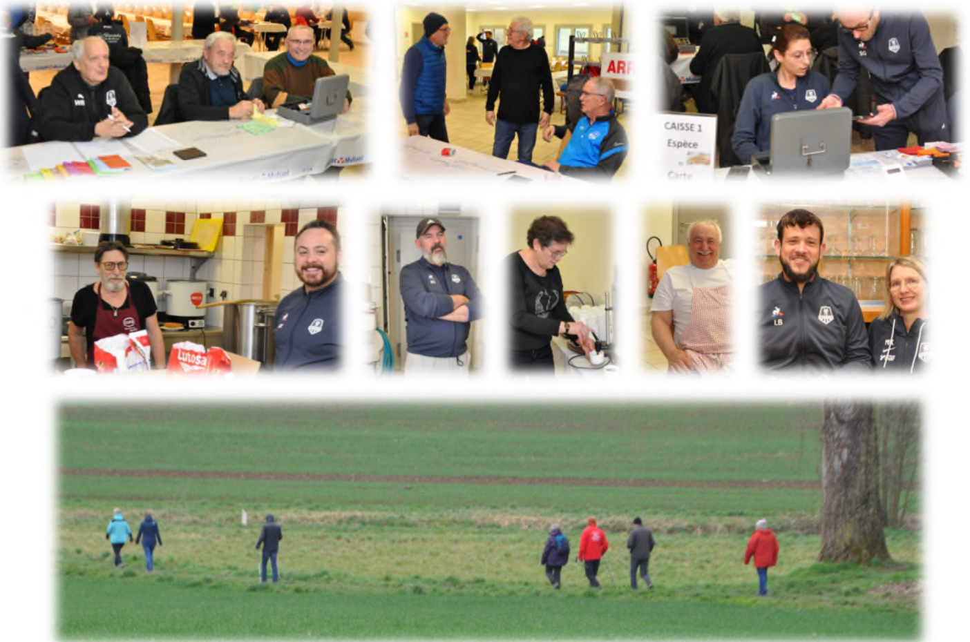
Marche organisée par AS Pfulgriesheim 7 et 11 km 578 PARTICIPANTS