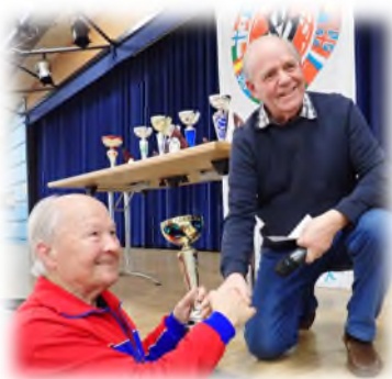
- remise coupe au marcheur le plus âgé par le président de la Chorale 1864 de Hégenheim

L'équipe de bénévoles était présente pour assurer le service, pâtisserie et cuisine.