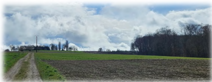
facebook les marcheurs du schneckenberg