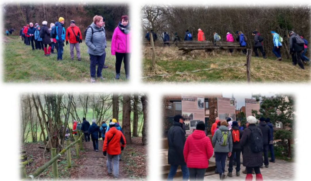
photos des Laufer de Woerth