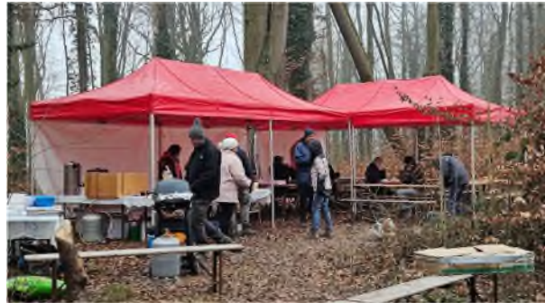
Facebook Tschill P