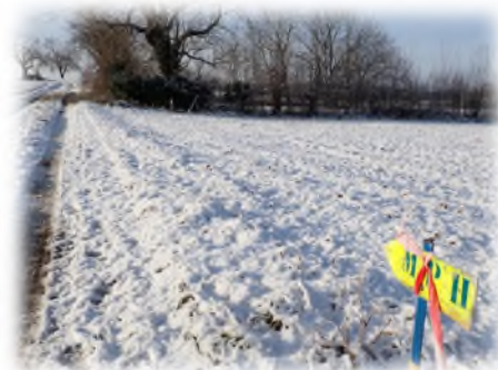
- partie du parcours