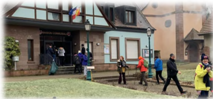
Facebook Kopff Monique

Au retour ils ont pu se restaurer avec nos traditionnelles Bouchée à la Reine.