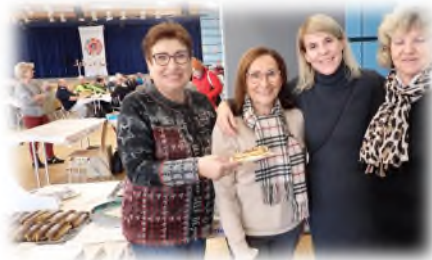
- dames bénévoles à la pâtisserie