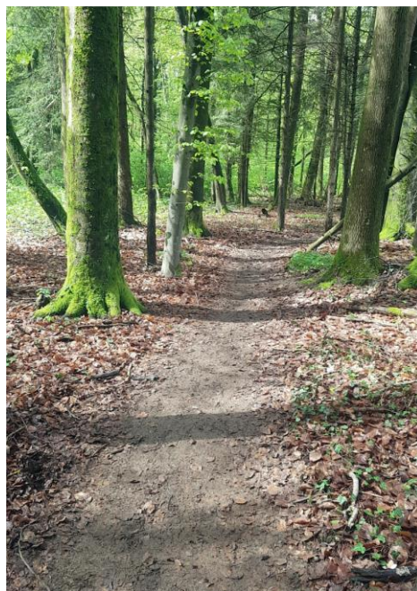
Le chemin au cœur de la forêt

Assurance : la FFSP est garantie en responsabilité civile auprès de Groupama. L'inscription à la marche vaut déclaration de bonne santé. L'organisateur décline toute responsabilité en cas de maladie, d'accident ou de vol.