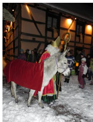
Animation de Saint Nicolas

La scierie qui fonctionnait grâce à une machine à vapeur.